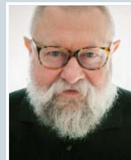
Prof. dr hab. Jerzy Bralczyk Przewodniczący Rady Programowej Europejskiego Forum Prawa i Edukacji

Miejsce: Warszawa, Centralna Biblioteka Rolnicza, ul. Krakowskie Przedmieście 66